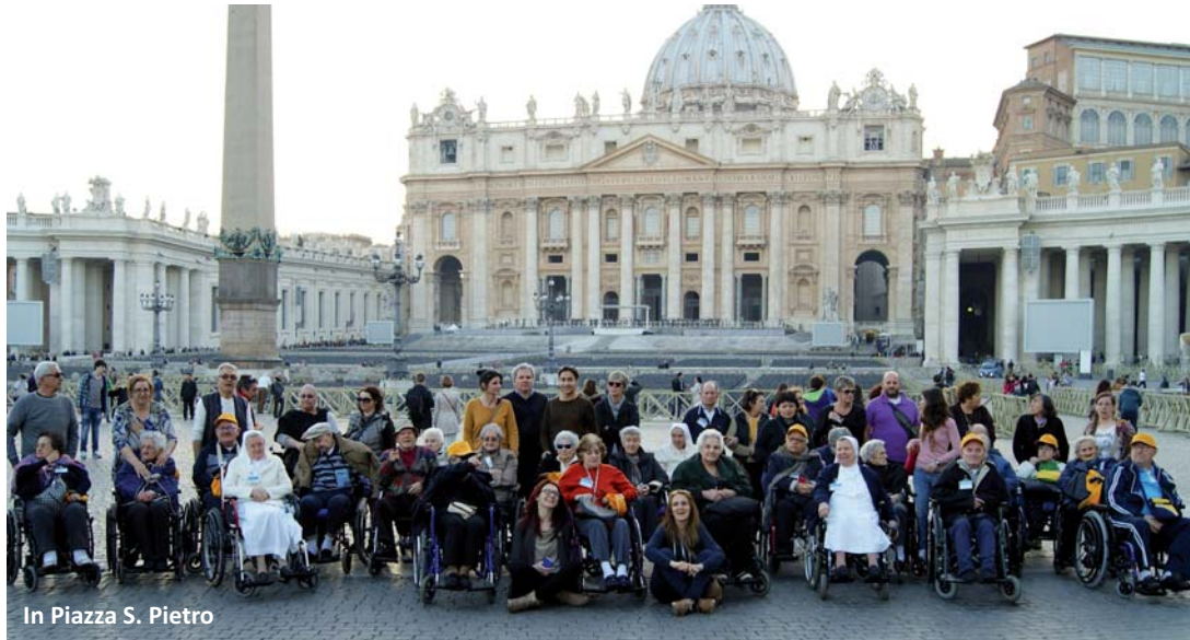
In Piazza S. Pietro

MARTEDI 18 , tour in pullman fino a piazza Venezia e poi visita alla Fontana di Trevi, al Pantheon e a Piazza Navona. Nel pomeriggio, visita alla Basilica di San Pietro.