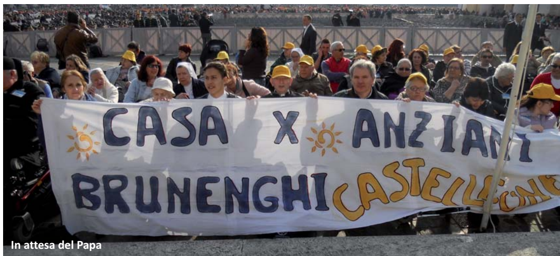
In attesa del Papa

Grazie al Gruppo Solidale Ospiti Brunenghi e a tutti i volontari per le belle giornate trascorse insieme!